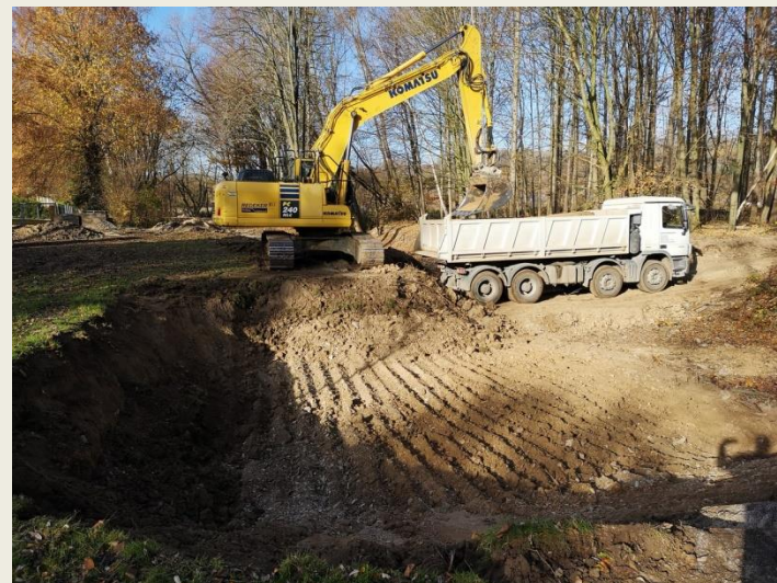
15.11.2018 Aufweitung Altenaupark