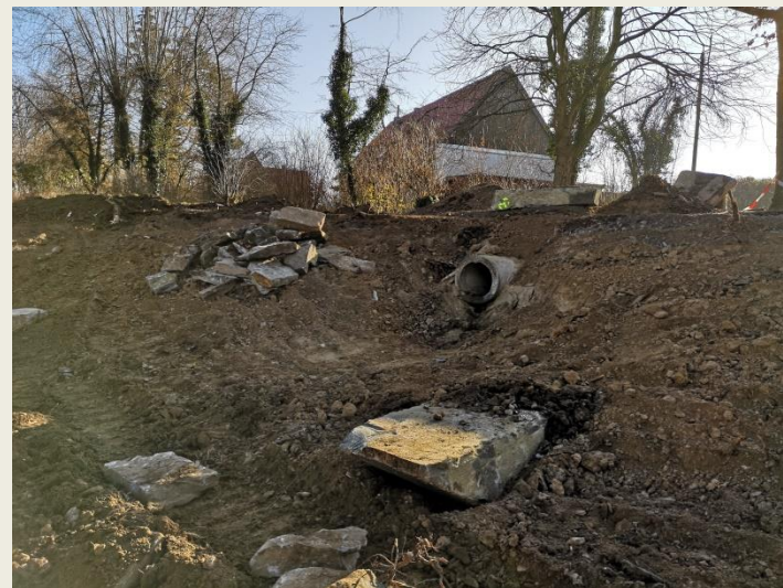
23.11.2018 Umbau Einleitungsbauwerk