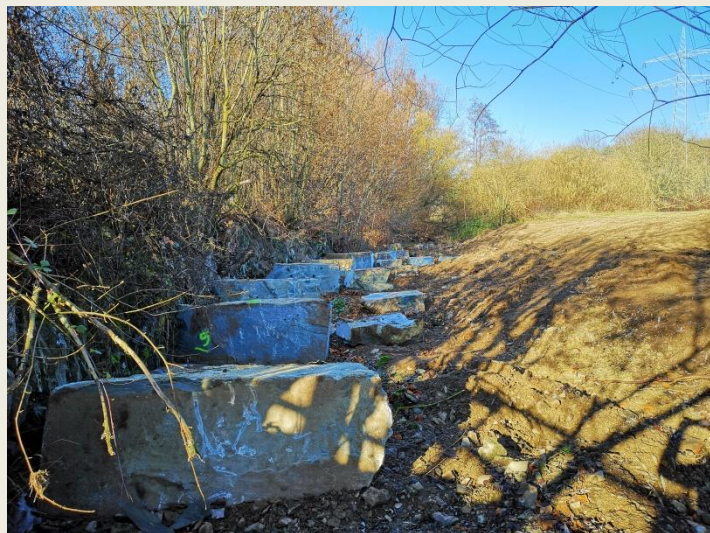
23.11.2018 Aufweitung Altenaustrand