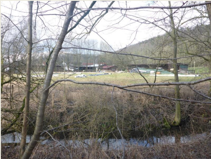
01.03.2017 Angrenzende private Flächen