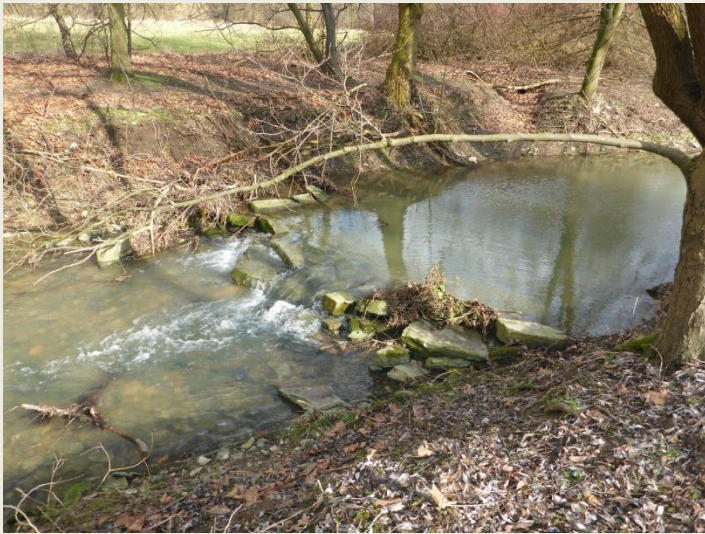
01.03.2017 Sohlschwelle aus Uferbefestigung