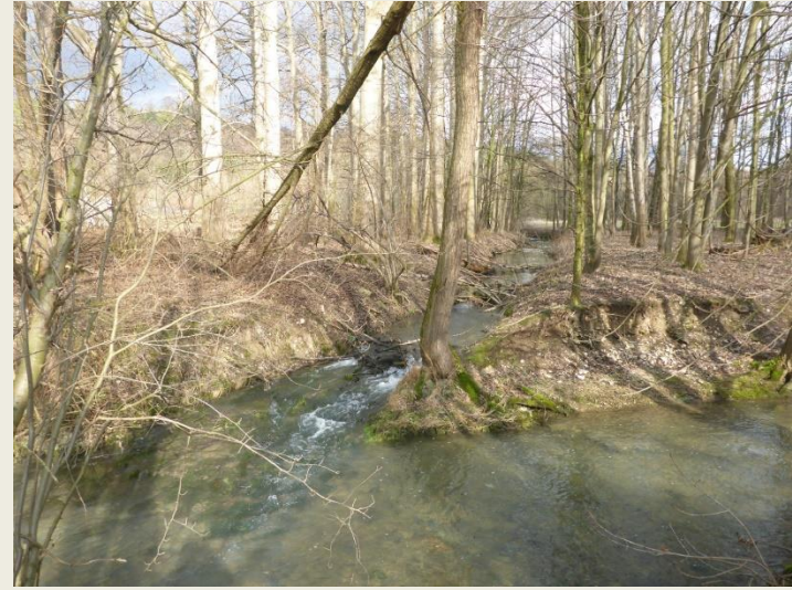
01.03.2017 Einmündung des Quellborns