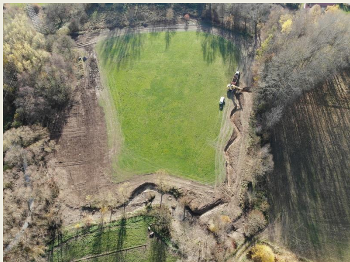
14.11.2018 Neuanlegung Quellgerinne